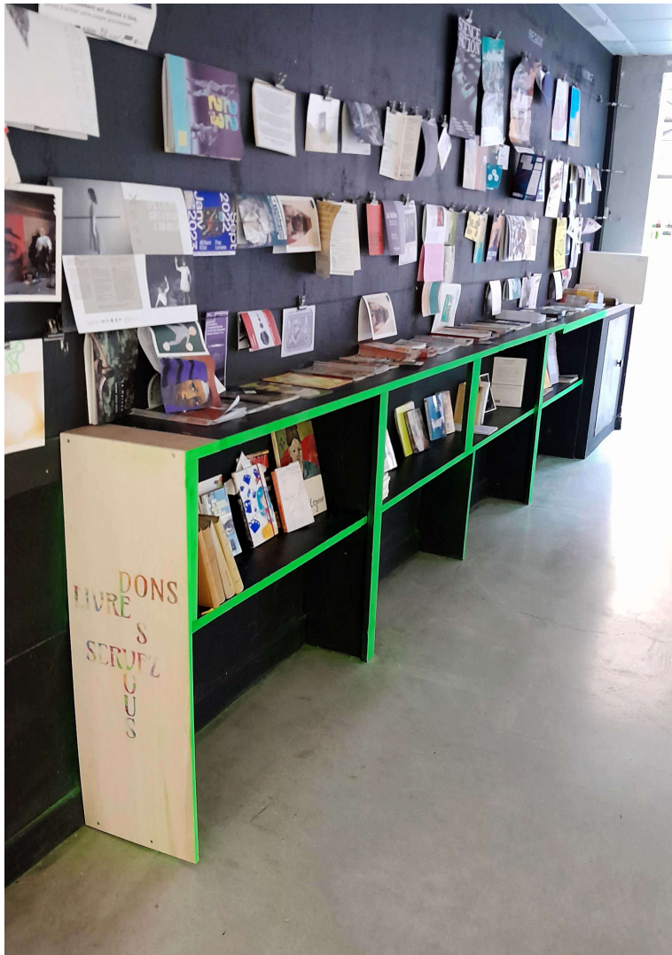
* étagère à livre dans le hall